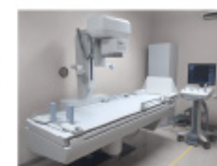
Canon社製 X線テレビ装置