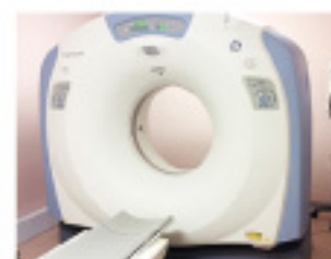
GE社製マルチスライスCT