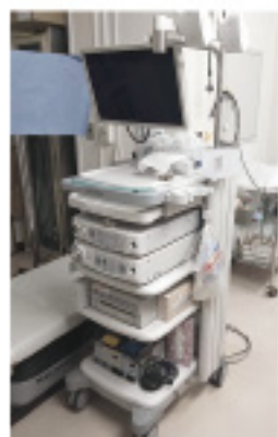
富士フイルム社製 内視鏡