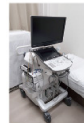
Canon社製 超音波診断装置

超音波診断装置は、高品質な画像を提供するAplioシリーズを新たに導入いたしました。内視鏡システムは、口から内視鏡を入れる経口内視鏡検査のほか、鼻から細径内視鏡を入れる経鼻内視鏡検査を行う事も出来ます。患者様中心の医療を心がけ、診断精度の高い検査を行っております。