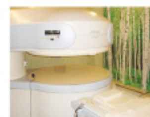
日立社製オープン型MRI